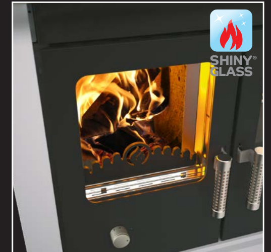
Feuerraumtür mit doppelt verglastem und selbstreinigendem Sichtfenster Shiny Glass®