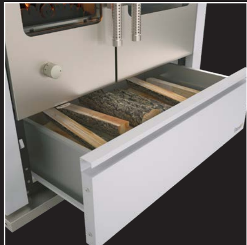
Großräumige Holzlade auf Schienensystem