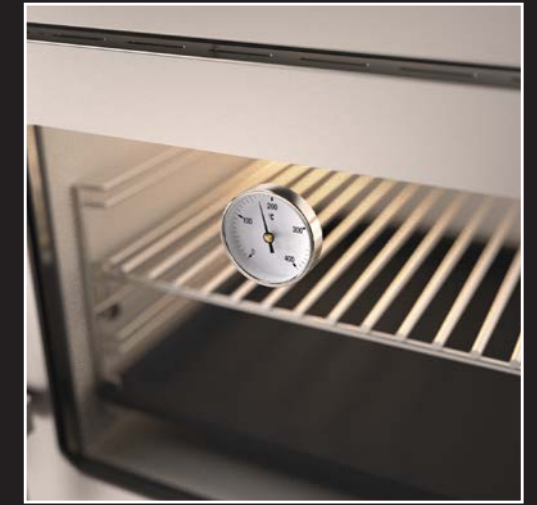
Backofen mit Innenbeleuchtung und Thermometer