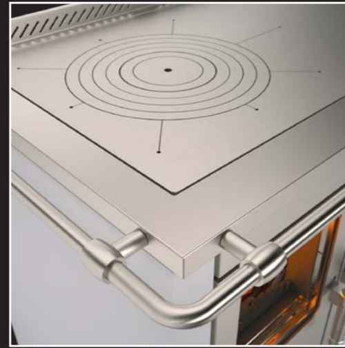
Leistungsfähige, dicke Stahl-Herdplatte