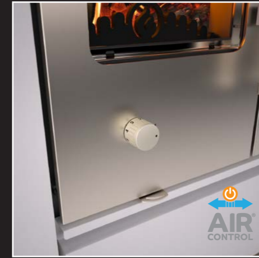
Vorrichtung der automatischen Luftregulierung Air Control®