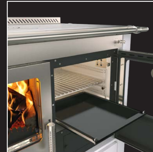
Edelstahl-Backofen mit Backblech auf Teleskopschienen und Dampfableitungsventil