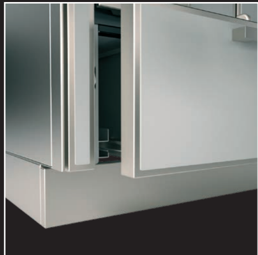
Großräumige Holzlade mit gedämpftem Selbsteinzug Soft Close