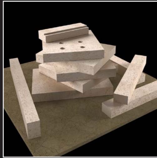
Großzügige und hochwertige Schamottierung der Brennkammer und der doppelten Rauchzüge