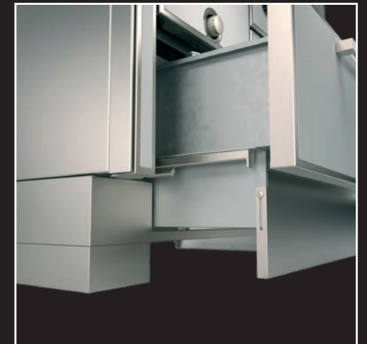
Teleskop-Sockel mit integrierter Holzlade (Optional)