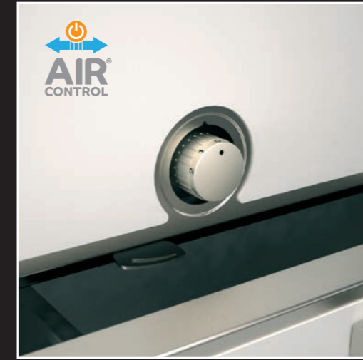
Vorrichtung der automatischen Luftregulierung Air Control®