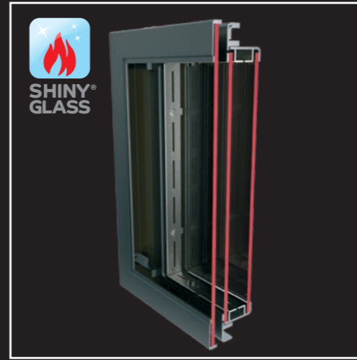
Dreifach verglaste, selbstreinigende Feuerraumtür Shiny Glass®