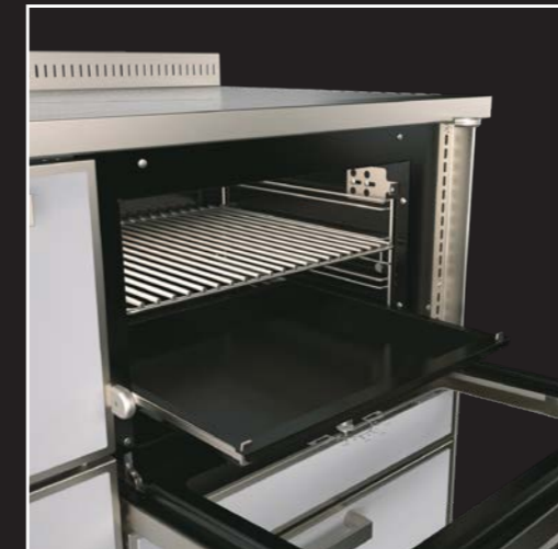
Emaillierte, pyrolitische Backofen- Innenverkleidung mit Innenbe- leuchtung, Thermometer, Backblech und Grillrost