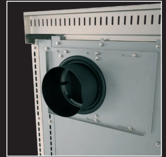
Regulierbarer Rauchausgang auf der Rückseite zur maximalen Flexibilität bei der Installation