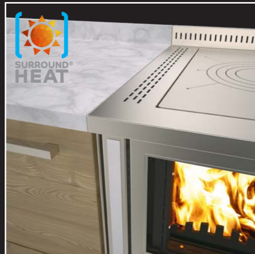
Surround Heat® System für eine max. Einbau-Sicherheit zwischen den Möbeln