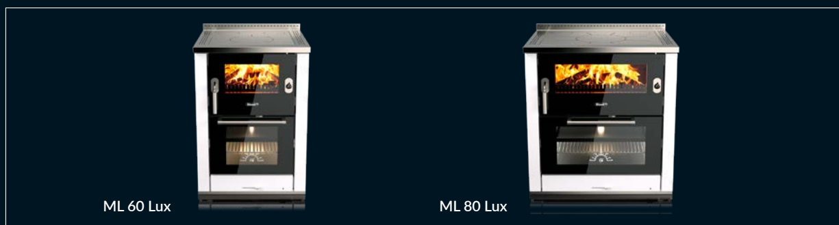
ML 60 Lux