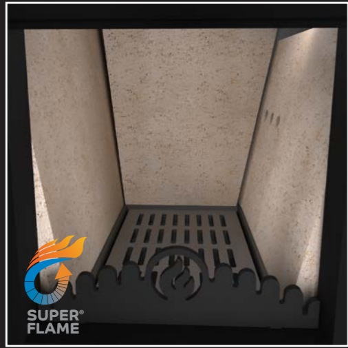
Innovatives Verbrennungssystem Superflame®