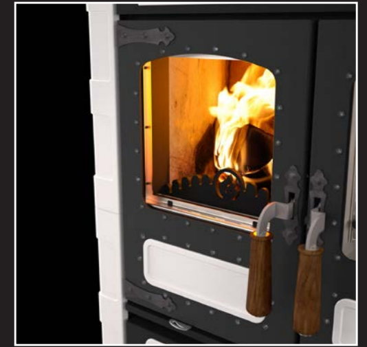
Genietete, antike Türen