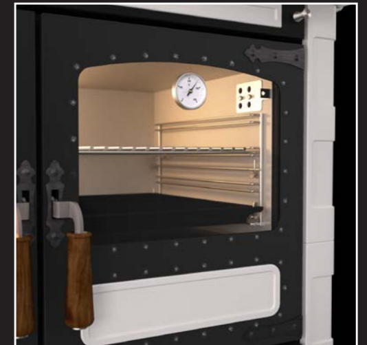
Backofen mit Innenbeleuchtung und Thermometer