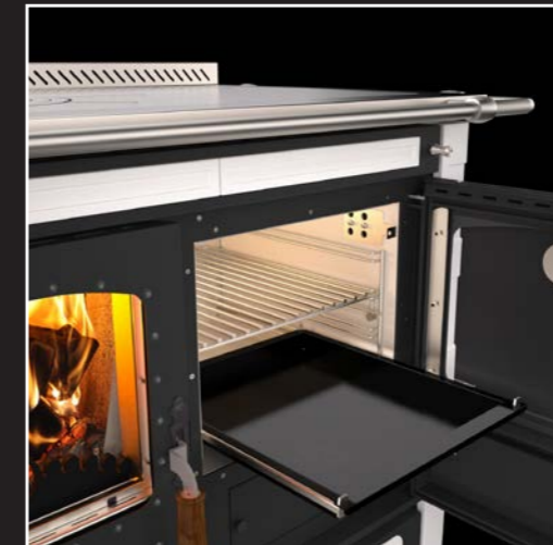
Edelstahl-Backofen mit Backblech auf Teleskopschienen und Dampfableitungsventil