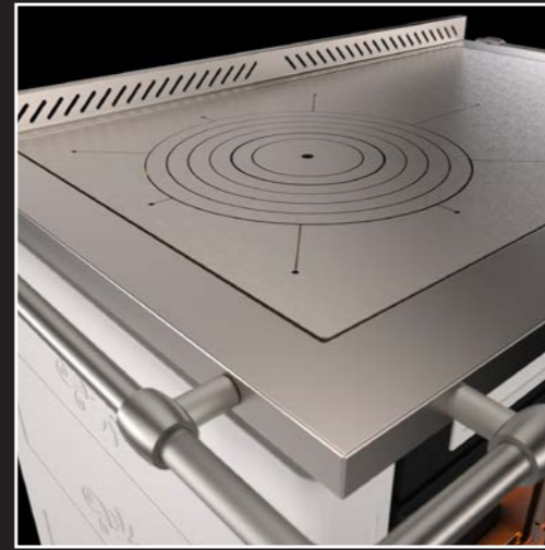
Leistungsfähige, dicke Stahl-Herdplatte