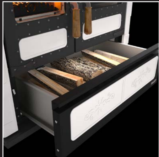
Großräumige Holzlade auf Schienensystem