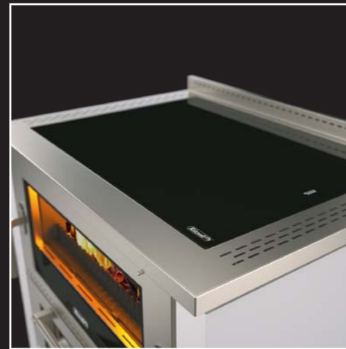
Hochleistungsfähige Stahl-Herdplatte oder Glaskeramik-Herdplatte