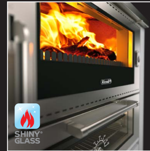
Feuerraumtür mit doppelt verglastem und selbstreinigendem Sichtfenster Shiny Glass®