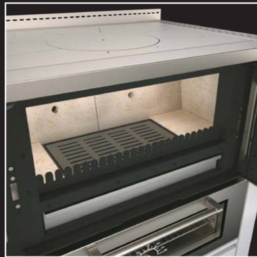
Großzügige und hochwertige Schamottierung der Brennkammer und der doppelten Rauchzüge