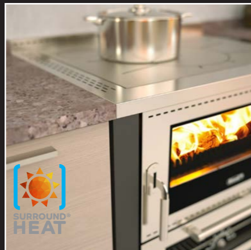
Surround Heat® System für eine max. Einbau-Sicherheit zwischen den Möbeln