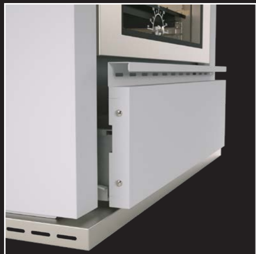
Großräumige Holzlade mit gedämpftem Selbsteinzug Soft Close