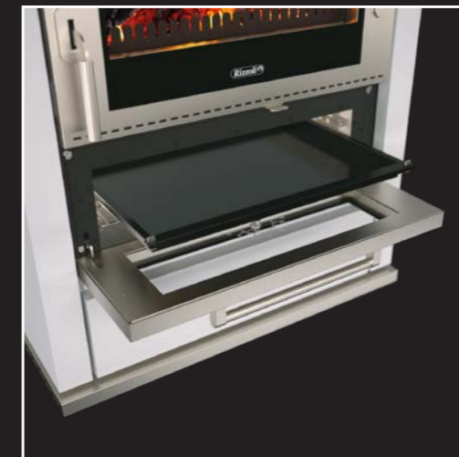
Großer Edelstahl-Backofen mit Innenbeleuchtung, Backblech auf Teleskopschienen und Grillrost