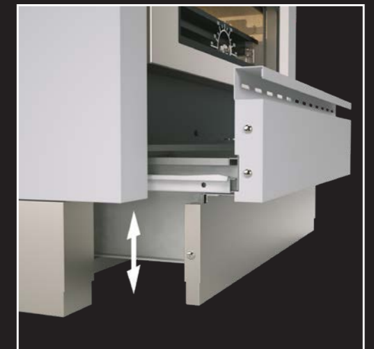
Teleskop-Sockel mit integrierter Holzlade (Serie MZ)